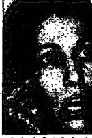
ابراهيم بن بوعزيزي وزير العدل الجزائري